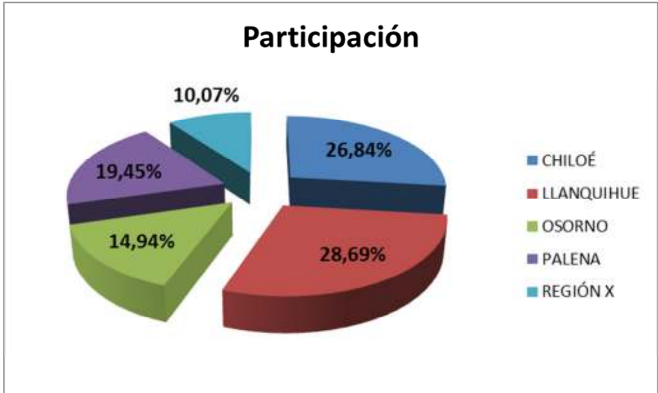
Gráfico 2. Participación FNDR segmentada por Provincias.