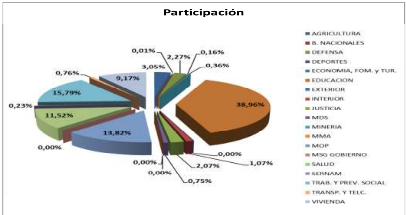
Gráfico 1. Participación segmentada por Ministerio.