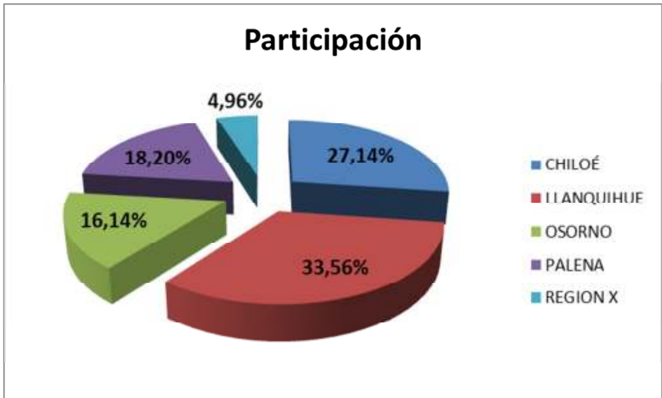
Gráfico 2. Participación FNDR segmentada por Provincias.