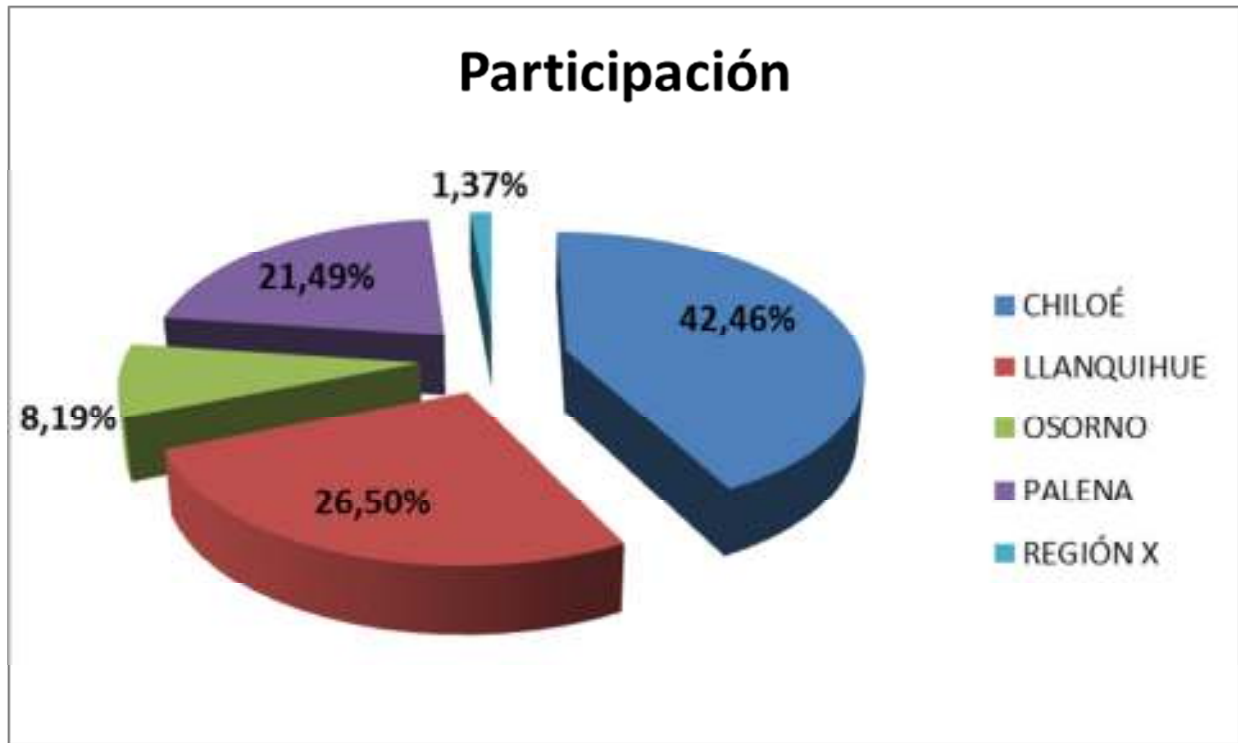
Gráfico 2. Participación FNDR segmentada por Provincias.