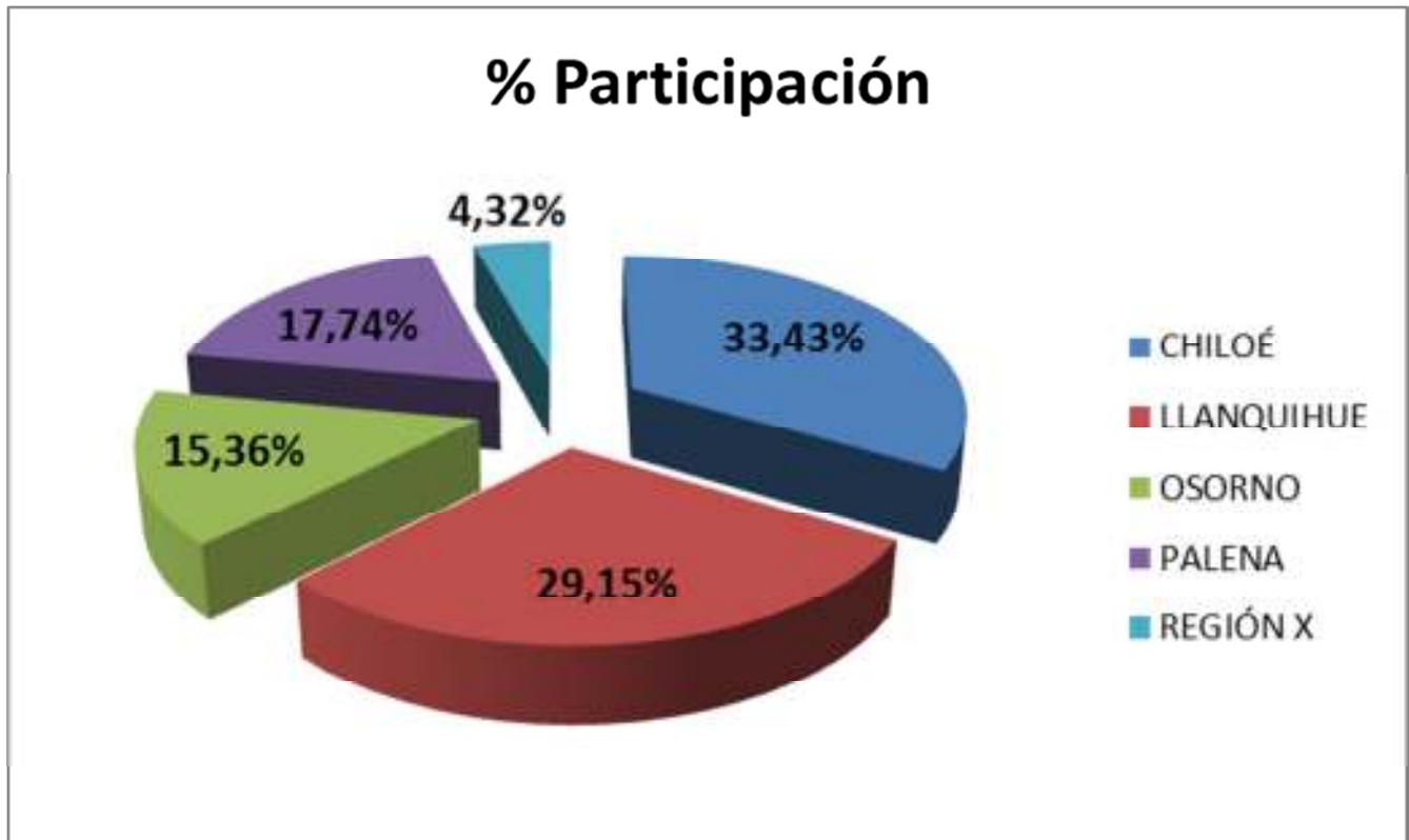
Gráfico 2. Participación FNDR segmentada por Provincias.