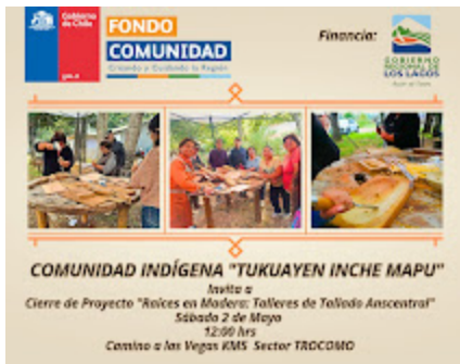
Invitación Tukuayen.jpeg 202K