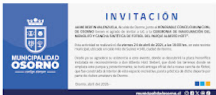
Invitacion 1 (1).jpg 315K

Este mensaje y sus adjuntos se dirige exclusivamente a su destinatario(a), puede contener información privilegiada o confidencial y es para uso exclusivo de la persona o entidad de destino. Si no es usted el destinatario indicado, queda notificado de que la lectura, utilización, divulgación y/o copia sin autorización puede estar prohibida en virtud de la legislación vigente. Si ha recibido este mensaje por error, le rogamos que se comuniqué inmediatamente por esta misma vía o proceda a su inmediata eliminación.