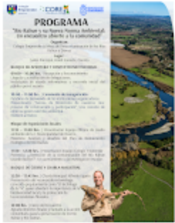
PROGRAMA EVENTO MEDIOAMBIENTAL HOTEL SONESTA.png 4354K