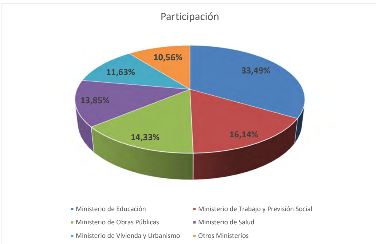
Gráfico 1. Participación segmentada por Ministerio.