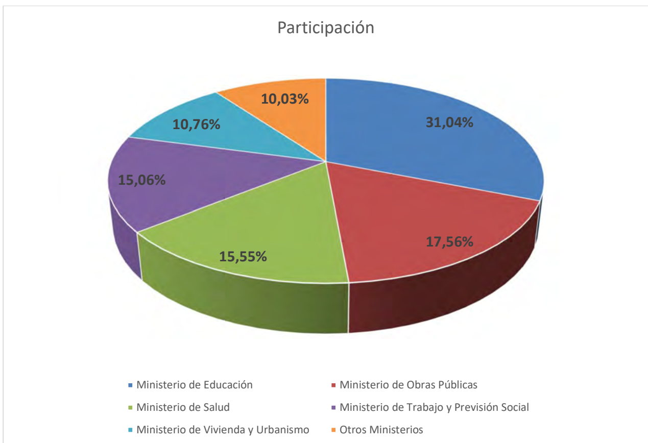
Gráfico 1. Participación segmentada por Ministerio.