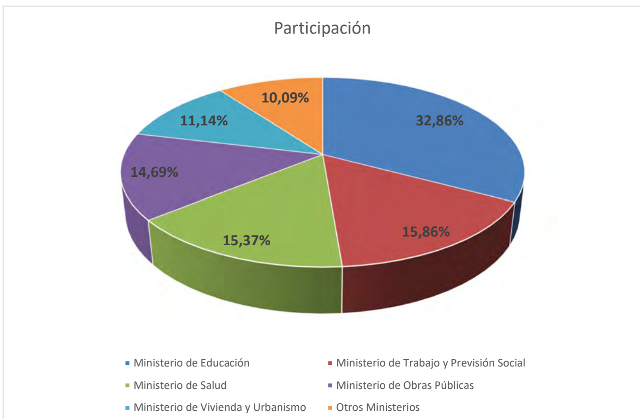
Gráfico 1. Participación segmentada por Ministerio.