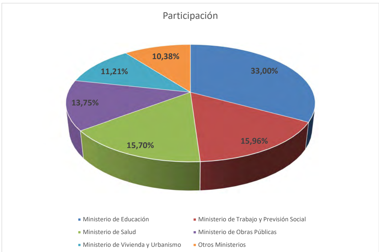
Gráfico 1. Participación segmentada por Ministerio.

Fuente: Elaboración propia basada en la plataforma Chile Indica