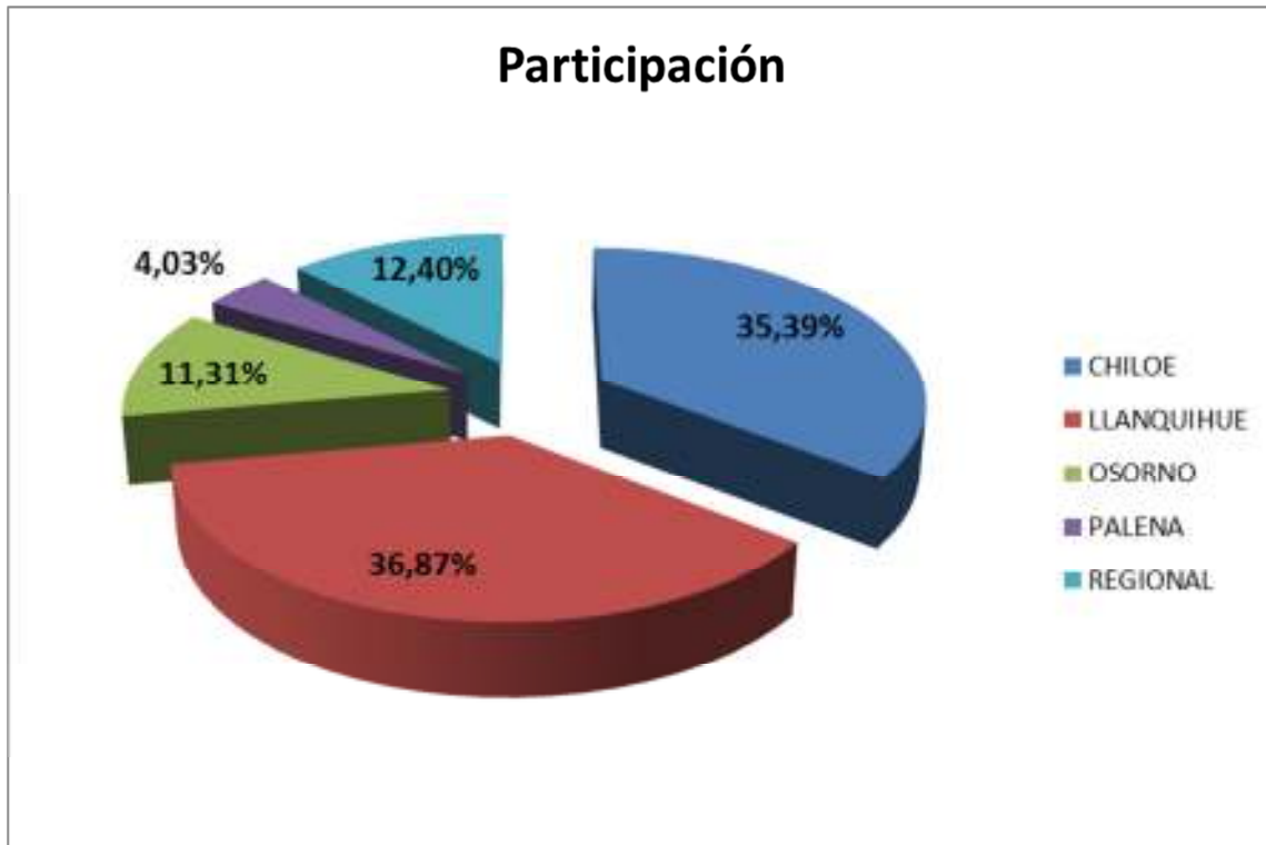
Gráfico 2. Participación FNDR segmentada por Provincias.